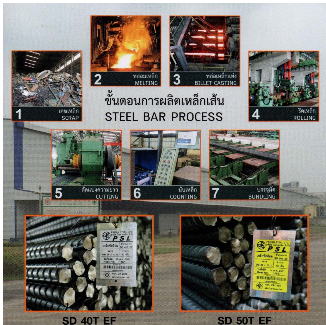
ภาพที่ 1.4 กระบวนการผลิต

โครงการมีการผลิตหลอมและหล่อเหล็กแท่ง จำนวน 2 สายการผลิต ซึ่งมีเตาหลอมทั้งหมด 2 เตา ขนาด 50 ตัน/เตา และมีการใช้พื้นที่แบ่งเป็น 4 แผนก ตามขั้นตอนหลักในการผลิต ได้แก่ 1) แผนกเตรียมเศษเหล็ก, 2) แผนกหลอมเหล็ก, 3) แผนกหล่อเหล็กแท่ง และ 4) แผนกจัดเก็บผลิตภัณฑ์ ซึ่งปัจจุบันดำเนินการผลิต เพียง 1 เตาหลอมในสายการผลิตที่ 1 และสายการผลิตที่ 2 ยังไม่เปิดดำเนินการ